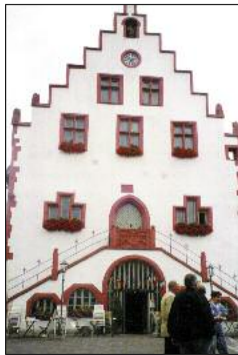
L'ancienne mairie de Karlstadt est aujourd'hui une salle de réception officielle.